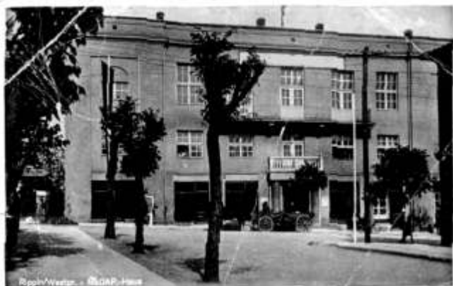
Budynek Domu Ludowego za okupacji

Ponad 40 lat działalność kulturalna prowadzona w ramach instytucji odbywała się w „Katoliku” przy ulicy Kościuszki 10. Budynek ten wzniesiony został ze składek parafian i długi czas służył mieszkańcom. Tam odbywały się różnego rodzaju spotkania dobroczynne, bale charytatywne i poczęstunki dla dzieci - szczególnie podczas kościelnych uroczystości.