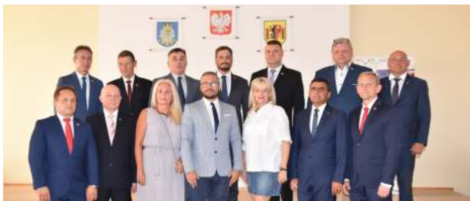
Rada Miasta Rypin kadencji 2014 - 2018