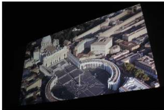
Projekcja „Święty Piotr i inne papieskie bazyliki Rzymu”

W ramach realizacji projektu „Wielka Sztuka na Ekranie” jesienią zeszłego roku mogliśmy zaprosić mieszkańców miasta na retransmisję opery „Carmen” G. Bizeta z Metropolitan Opera w Nowym Jorku oraz zabrać w unikalną podróż do wiecznego miasta, gdzie podziwiać można było najpiękniejsze Bazyliki Rzymu. Te wydarzenia były doskonałym zwieńczeniem projektu i spotkały się z dużym zainteresowaniem mieszkańców.