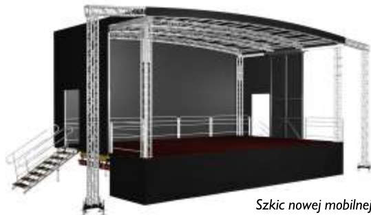
Szkic nowej mobilnej sceny

To najświeższy projekt, na który RDK otrzymał dofinansowanie z Ministerstwa Kultury i Dziedzictwa Narodowego w wysokości 66 000 zł oraz wsparcie od Gminy Miasta Rypin - 98 000 zł. Dotyczy on zakupu mobilnej sceny, która będzie wykorzystana do organizacji różnego rodzaju imprez kulturalnych w plenerze. Fakt posiadania własnej sceny plenerowej niezwykle przyczyni się do stworzenia optymalnych warunków dla działalności w zakresie edukacji kulturalnej, a także uatrakcyjni bieżącą ofertę kulturalną i infrastrukturalną Rypińskiego Domu Kultury, ułatwi dostęp do proponowanych wydarzeń artystycznych szerokiej grupie odbiorców. Dzięki zakupowi sceny oraz elementów nagłośnienia i oświetlenia miejskie wydarzenia kulturalne będą łatwiejsze w organizacji i zminimalizują koszty związane z najmem tego typu wyposażenia dla koncertujących w plenerze gwiazd estradowych oraz amatorskich zespołów młodzieżowych, wokalistów, czy teatrów. Wygenerowane oszczędności RDK zostaną wykorzystane na realizację zadań statutowych.