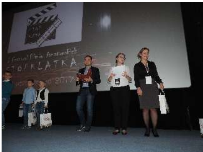
Wręczenie nagród laureatom konkursu plastycznego ogłoszonego w ramach Stopklatki

Kolejną, miłą konsekwencją realizacji projektu było stworzenie nowego, cyklicznego wydarzenia: Festiwalu Filmów Amatorskich „Stopklatka”. W październiku 2017 roku odbył się konkurs etiud filmowych zgłoszonych do Festiwalu. Przez dwa dni jurorzy oglądali zgłoszone prace i debatowali nad werdyktem. Galę finałową poprzedziło rozstrzygnięcie konkursu plastycznego dla najmłodszych „Mój ulubiony bohater filmowy”. Dzieci miały możliwość zobaczenia bloku krótkometrażowych bajek oraz filmu „Nowe przygody dzieci z Bullerbyn”. Dla młodzieży i dorosłych widzów odwiedzających w tym czasie kino także znalazły się filmowe niespodzianki. Festiwal Filmów Amatorskich „Stopklatka” ma już swoje stałe miejsce w kalendarzu imprez kulturalnych. Druga edycja będzie miała miejsce już 25-26 października br.