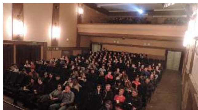
Pełna sala publiczności