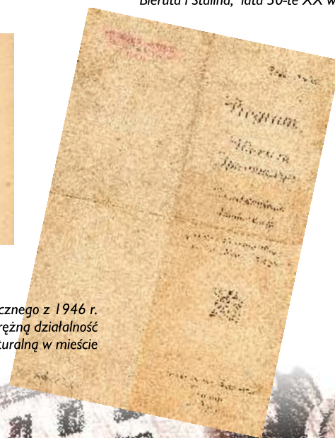
Program wydarzenia artystycznego z 1946 r. to doskonały dowód na prężną działalność kulturalną w mieście