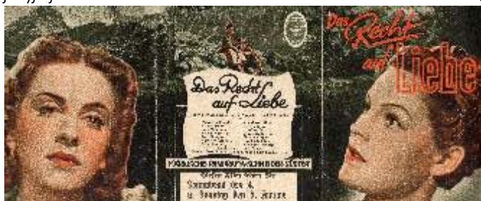
Afisz niemieckiego filmu, 1939 r.