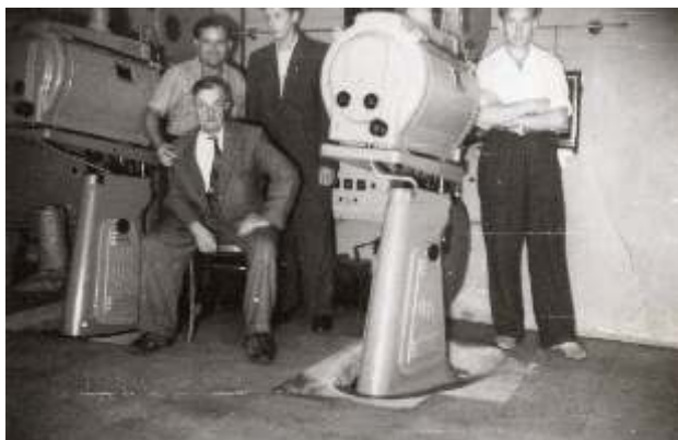
Zatoga kina w przedwojennej kabine projekcyjnej