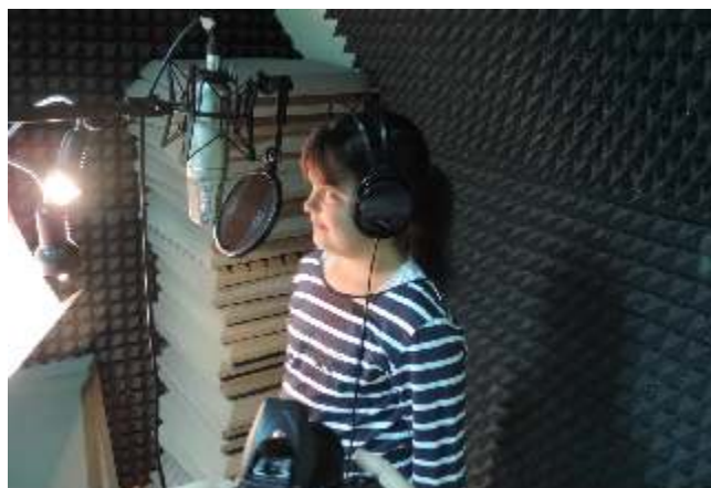
Zajęcia wokalne w Studio Nagrań cieszą się popularnością

To środki finansowe pozyskane w drodze konkursu ogłoszonego przez Burmistrza Miasta Rypin z okazji Dni Rypina. Celem konkursu jest wspieranie ciekawych inicjatyw mających promować miasto i służyć mieszkańcom, podejmowanych przez jednostki organizacyjne, spółki miejskie i instytucje kultury. Rypiński Dom Kultury po raz pierwszy dotację w wysokości 10 tys zł otrzymał w 2012 roku na realizację Studia Nagrań.