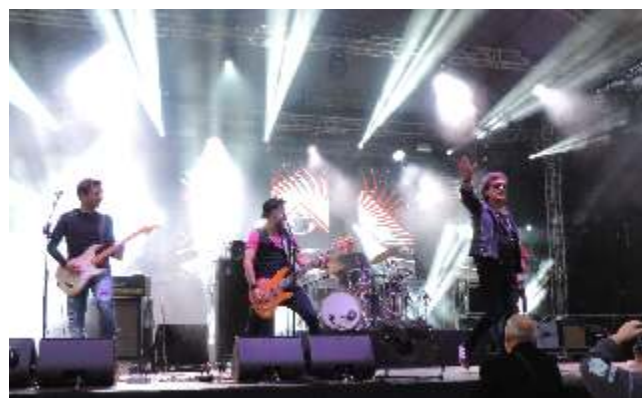
Dni Rypina 2018 - koncert zespołu Lady Pank