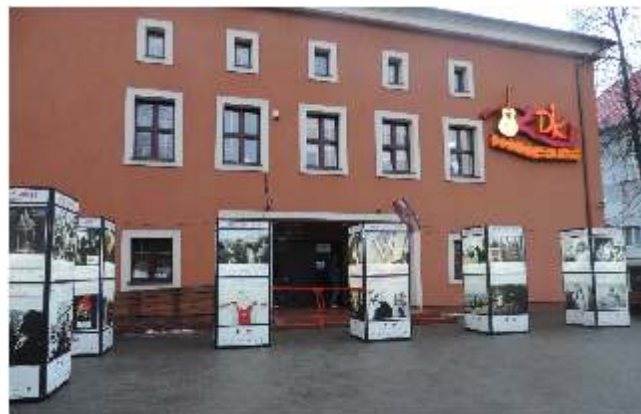
Wystawa gościła w Rypinie ponad miesiąc

Na bazie reaktywacji kina i w drodze realizacji projektu od jesieni 2016 roku funkcjonuje w instytucji Klub Miłośników Filmów , który skupia fanów ambitnego kina. Koneserzy filmów zaliczanych do klasyki światowego kina spotykają się raz w miesiącu na projekcji, a po niej wymieniają spostrzeżenia, dzielą się wrażeniami i dyskutują o obejrzanym filmie. Wyjątkowe spotkanie członków klubu miało miejsce w lutym 2017 roku, kiedy to w ramach KMF otwarta została wystawa poświęcona jednemu z najwybitniejszych polskich reżyserów. Dzięki współpracy w Filмотekę Narodową w Warszawie do Rypina udało się ściągnąć plenerową wystawę pt. „Andrzej Wajda 40/90”, która powstała z okazji 90 urodzin reżysera. Na placu przed kinem „Bałtyk” przez około cztery tygodnie można było zwiedzać podświetlaną wystawę, będącą swoistym podsumowaniem ponad czterdziestoletniej pracy artystycznej reżysera. Otwarcie wystawy połączone zostało ze spotkaniem Klubu Miłośników Filmów, gdzie obecni obejrzelі ostatnie dzieło mistrza - film „Powidoki”.