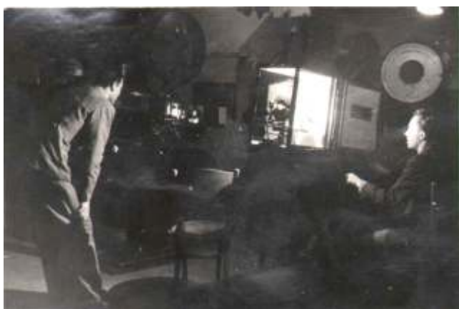
Kinooperatorzy przy pracy - okres międzywojenny