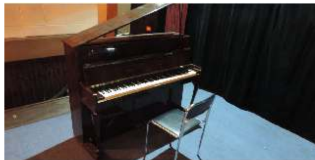
Stare i wystuzone pianino marki Offberg zastępił nowy akustyczny fortepian marki W.Hoffmann zbudowany w oparciu o technologie koncertu Carla Bechsteina.

Pozyskiwanie środków z zewnątrz umożliwiło instytucji zakup nowoczesnego, niezbędnego wyposażenia do prowadzenia właściwej działalności kulturalnej na dobrym poziomie. Dzięki wsparciu finansowemu możemy zapewnić nie tylko bardziej atrakcyjne wydarzenia, ale także stworzyć lepsze warunki dla rozwoju amatorskiego ruchu artystycznego. Droga aplikowania nie zawsze jest prosta, jednak bez podejmowanych prób nie udało by się zrealizować tak wiele w ostatnim czasie. To dzięki takim możliwościom jak programy ministerialne i inne źródła wspierające kulturalne zamierzenia nasza instytucja robi duże kroki naprzód. Postęp technologiczny i rosnące oczekiwania odbiorców sprawiają, że musimy dążyć bezustannie do polepszania jakości świadczonych usług. Mamy nadzieję, że nadal będziemy realizować ciekawe wydarzenia kulturalne, korzystając często ze wsparcia i możliwości jakie niesie za sobą pozyskiwanie środków zewnętrznych.