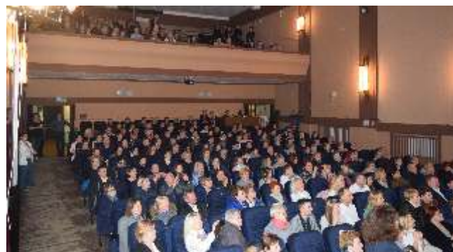
Takie widoki cieszą oczy

Projekt „Cyfryzacja Kina Bałtyk” był strzałem w dziesiątkę. Potrzeba funkcjonowania kina w ponad 17 tys mieście powiatowym nie podlega wątpliwości. Zakup projektora spowodował, że RDK postanowił aplikować o kolejne środki, dzięki którym polepszyła się jakość świadczonych usług.