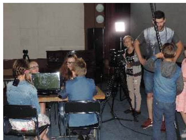
Niektóre sceny kręcono jeszcze w starej sali kina