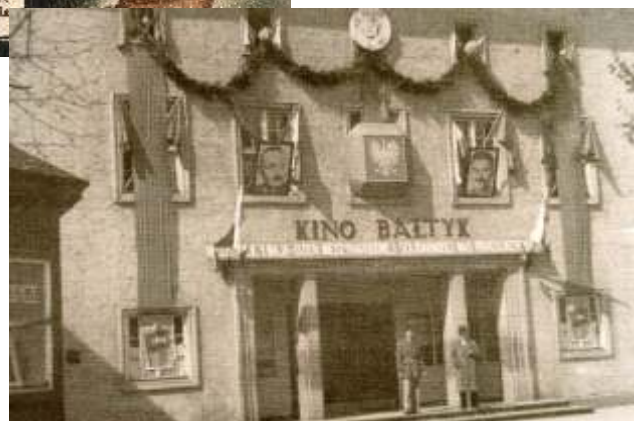
Udekorowany front kina z okazji 1 maja, w oknach portrety Bieruta i Stalina, lata 50-te XX w.