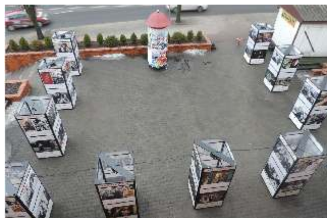
Plac przed kinem z perspektywy