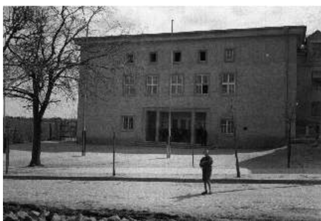
Budynek kina w czasie okupacji