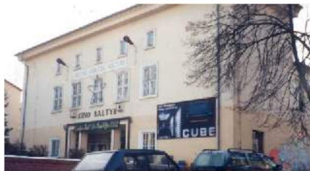
Budynek kina „Bałtyk” - lata 90-te XX wieku

Zmiany w polityce lokalnej, nowe potrzeby i wyzwania sprawiły, że w 1999 roku ówczesne władze miasta podzieliły Rypiński Ośrodek Kultury na trzy odrębne i samodzielne instytucje: Muzeum Ziemi Dobrzyńskiej, Miejską Bibliotekę Publiczną oraz Miejski Ośrodek Kultury wraz z kinem „Bałtyk”, a rok później zdecydowano o zmianie lokalizacji z budynku przy ul. Kościuszki 10 zwanego „Katolikiem” na budynek kina „Bałtyk” przy ul. Warszawskiej 8, gdzie do dziś funkcjonuje RDK. W związku z dynamicznym rozwojem, jaki przechodził dom kultury rok po roku starano się adaptować kolejne pomieszczenia kina do prowadzenia działalności kulturalnej. Powstały tu: pracownia plastyczna, sala prób, pomieszczenia instruktorskie i administracyjne, kameralna sala konferencyjna „Muza”, a także w 2012 r. Studio Nagrań. W roku 2009 roku została wykonana termomodernizacja elewacji budynku oraz przeprowadzono remont pomieszczeń administracyjnych i pracowni instruktorskich. Hole kinowe stały się swoistą galerią, gdzie prezentowano konkursowe prace plastyczne dzieci i młodzieży. Sala kinowa, która także pełniła rolę widowiskowej została odświeżona wraz z przyległymi do niej garderobami, wymieniono fotele dzięki dotacji z MKiDN.