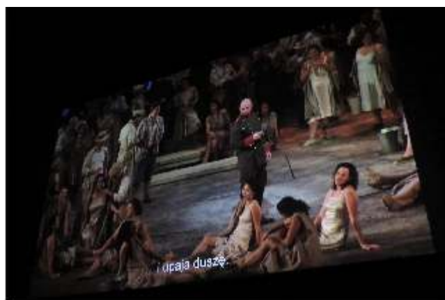
Retransmisja opery „Carmen” z MET w Nowym Jorku

„Wielka Sztuka na Ekranie”, dzięki której Rypiński Dom Kultury zyskał nowoczesny ekran kinowy, sprzęt multimedialny (kamerę cyfrową, komputer wraz z oprogramowaniem) została profesjonalnie podsumowana podczas spotkania „Filmowy Rypin”, gdzie zaprezentowano powstałe podczas wakacyjnych warsztatów film, etiudy filmowe laureatów „Stopklatki” oraz wykazano potrzebę podejmowania podobnych inicjatyw w najbliższej przyszłości kulturalnej miasta.