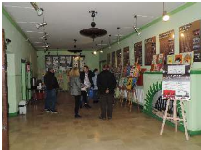
Wystawa „Mój ulubiony bohater filmowy”

W ramach realizacji projektu „Wielka Sztuka na Ekranie” jesienią zeszłego roku mogliśmy zaprosić mieszkańców miasta na retransmisję opery „Carmen” G. Bizeta z Metropolitan Opera w Nowym Jorku oraz zabrać w unikalną podróż do wiecznego miasta, gdzie podziwiać można było najpiękniejsze Bazyliki Rzymu. Te wydarzenia były doskonałym zwieńczeniem projektu i spotkały się z dużym zainteresowaniem mieszkańców.