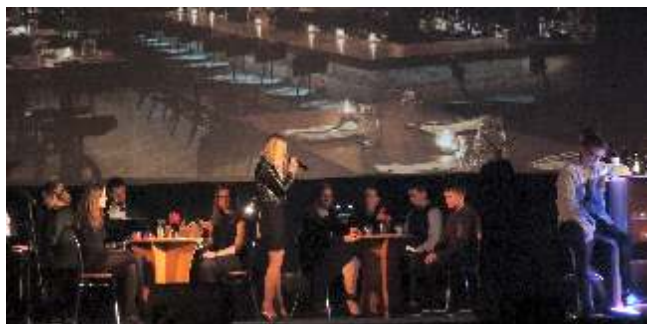
Spektakl „Ale czy warto...” poświęcony twórczości E.Stachury