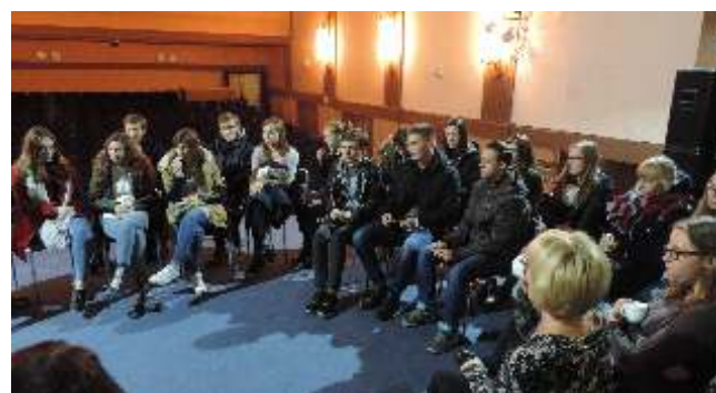
Klub Miłośników Filmów i rozmowy po seansach profilaktycznych