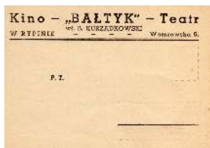
Przedwojenna kartka pocztowa z nadrukiem