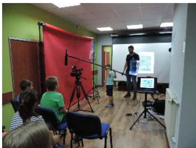
W zawodzie filmowca trzeba nabrać doświadczenia