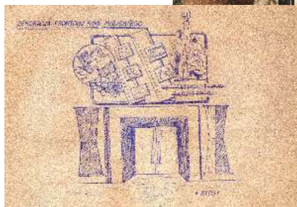
Centralne wytyczne - projekt dekoracji frontonu kina, 1954 r.