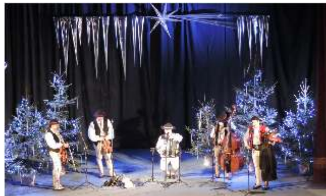
Koncert świąteczny „Oj maluśki...” - grudzień 2016

Po objęciu stanowiska dyrektorskiego przez Grzegorza Ziomka kalendarz imprez RDK wzbogacił się o nowe propozycje, które stały się formami cyklicznymi: