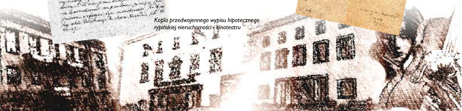
Kopія przedwojennego wypisu hipotecznego rypińskiej nieruchomości - kinoteatru