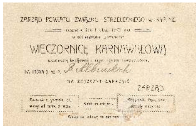
Zaproszenie na Wieczornicę karnawałową w kinoteatrze Colosseum, 1932 r