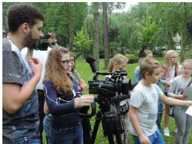
Praca w plenerze na planie filmowym

W ramach tego projektu udało się przeprowadzić cykl zajęć edukacyjnych dla dzieci. Podczas wakacji w naszej instytucji odbyły się Wakacyjne Warsztaty Filmowe. Grupa młodych ludzi poznała tajniki tworzenia filmów i pozyskaną teorię przełożyła na praktykę. W ramach zajęć dzieci stworzyły scenariusz etiudy filmowej o tajemniczym skarbie w Rypinie, a następnie podzieliły się na zespoły (operatorów kamer, reżyserów, dźwiękowców, oświetleniowców, aktorów) i z zaangażowaniem pracowały na planie. Prócz wielu cennych umiejętności jakie udało się opanować uczestnikom warsztatów, była to niesamowicie udana zabawa. Owocem zajęć jest etiuda filmowa, która prezentowana była wielokrotnie podczas kulturalnych wydarzeń w RDK.